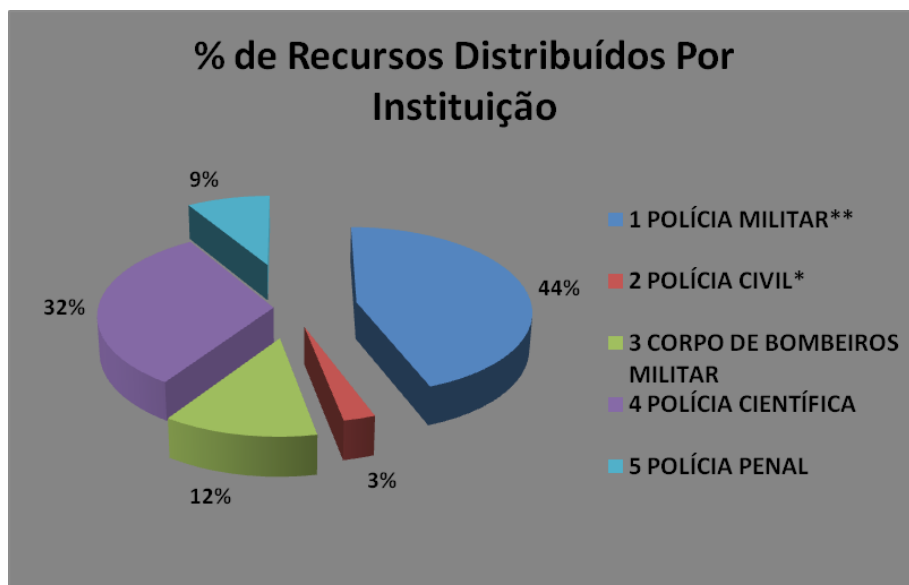
Gráfico 01 – Percentual de distribuição de itens por instituição

Exibiremos a seguir alguns gráficos com resultados provenientes do Projeto o Preço do Crime e MP Amigo das Bases.