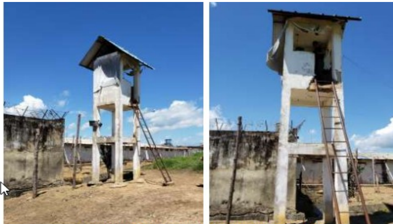
Figuras 5 e 6: Guarita externa no fundo do pátio do CRAMA