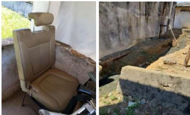
Figuras 7 e 8: Vista interna da guarita e vala de esgoto próxima da guarita