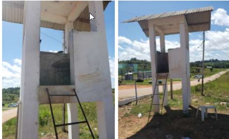
Figuras 1 e 2: Guarita da entrada do CRAMA.

Folha CSI. 31, Quadra 02, Lote 01 – Nova Marabá – CEP: 68.507-530 – Marabá/PA Telefone: (94) 3322-3277/3322-2156/3322-4818 – Fax: (94) 3322-1964 – www.prt8.mpt.gov.br